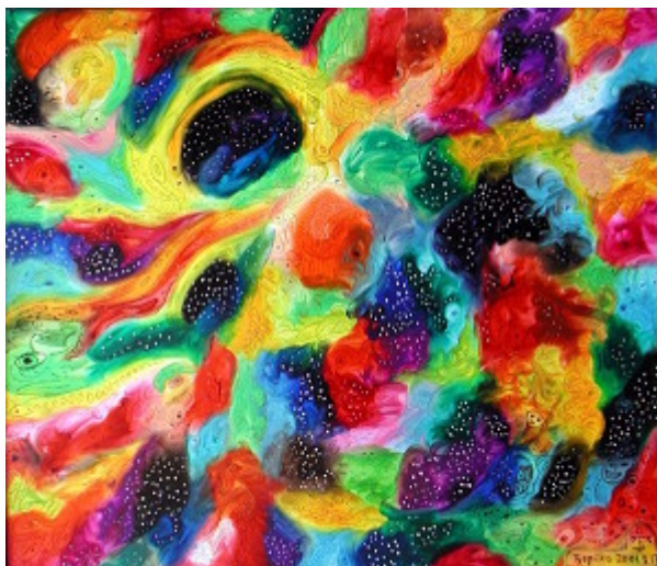
Kristóf Miklós: Univerzum 2001