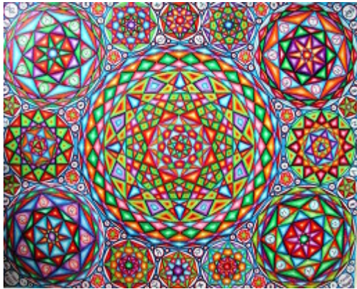
Ez az Uranita Mandala című képem.