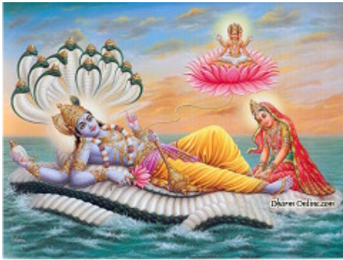
Vishnu és Srílaksmí, a Szerencse Istennője